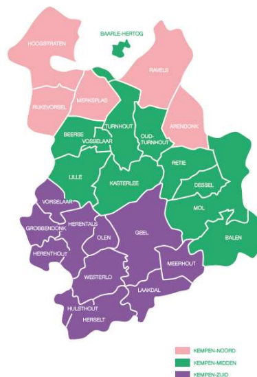
Figuur 2: werkingsgebieden Kempen-Noord, Kempen-Midden en Kempen-Zuid

De eengemaakte woonmaatschappij dient te blijven inzetten op klantgerichtheid. Dit betekent niet alleen een bereikbaar en nabij dienstverleningsaanbod voor huurders/kopers en kandidaat-huurders/kopers, maar betekent ook een divers aanbod inzake informatie, begeleiding en ontzorging. Ingevolge de opgelegde deadline door Vlaanderen, beslisten de gemeenten binnen de Antwerpse Kempen voor eind oktober 2021 tot de afbakening van volgende 3 werkingsgebieden: