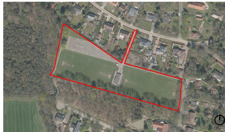
Figuur 1: Afbakening projectgebied op orthofoto